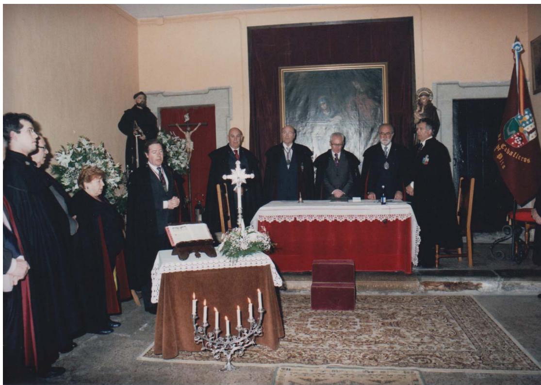
Momento de recogimiento in memoriam de las víctimas de las recientes catástrofes en Japón

Muy Noble y Muy Leal Orden de Caballeros de María Pita N° 33 – marzo – 2011